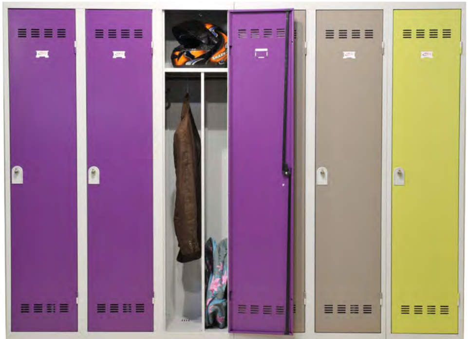
▲ Industrie salissante L40 cm (séparation médiane)