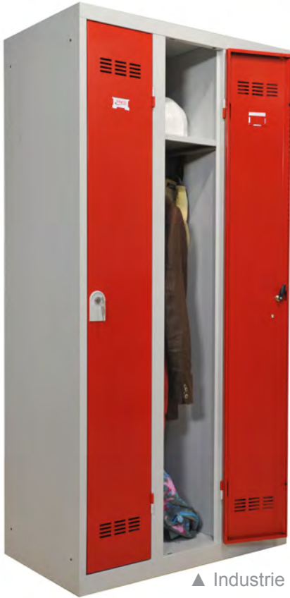
▲ Industrie propre L30 cm