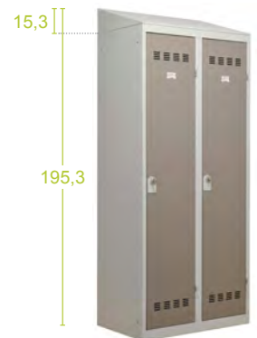
La coiffe - H15,3 cm