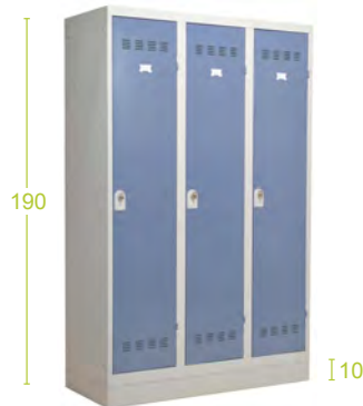
Le faux socle - H10cm