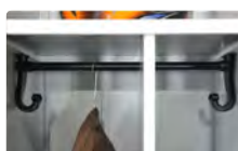
Industrie salissante colonne avec séparation médiane