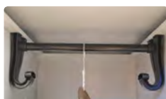
Industrie propre (colonne simple)