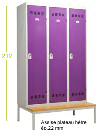
Le socle banc - H32cm