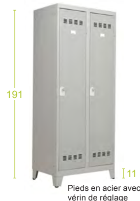
Les 4 pieds - H11cm